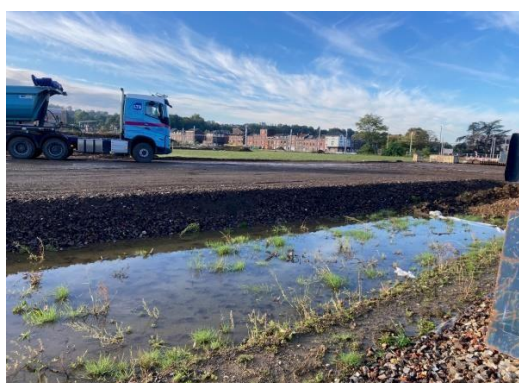
Apport des terres graves et pose du géotextile et empierrement